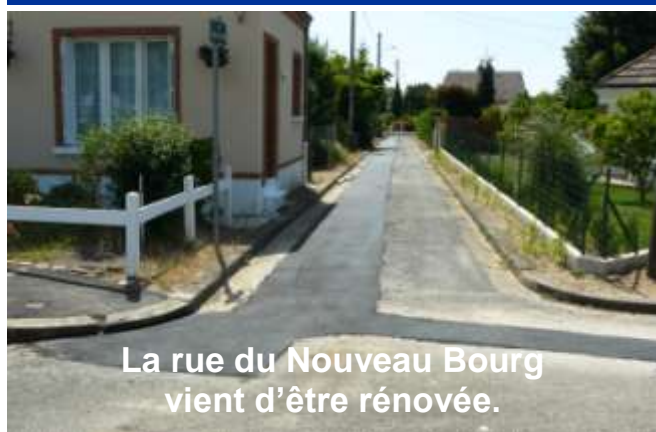
La rue du Nouveau Bourg vient d'être rénovée.