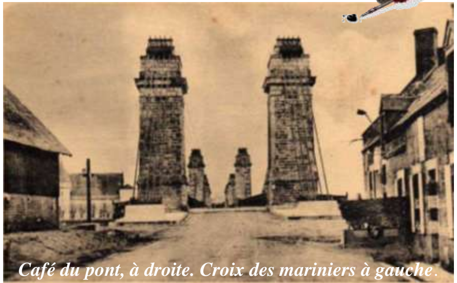
Café du pont, à droite. Croix des mariniers à gauche.